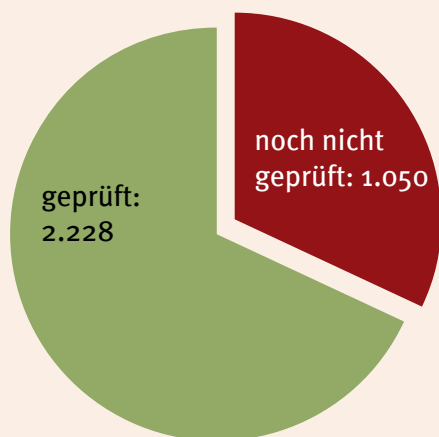
Grafik: IG Metall SOPAINFO